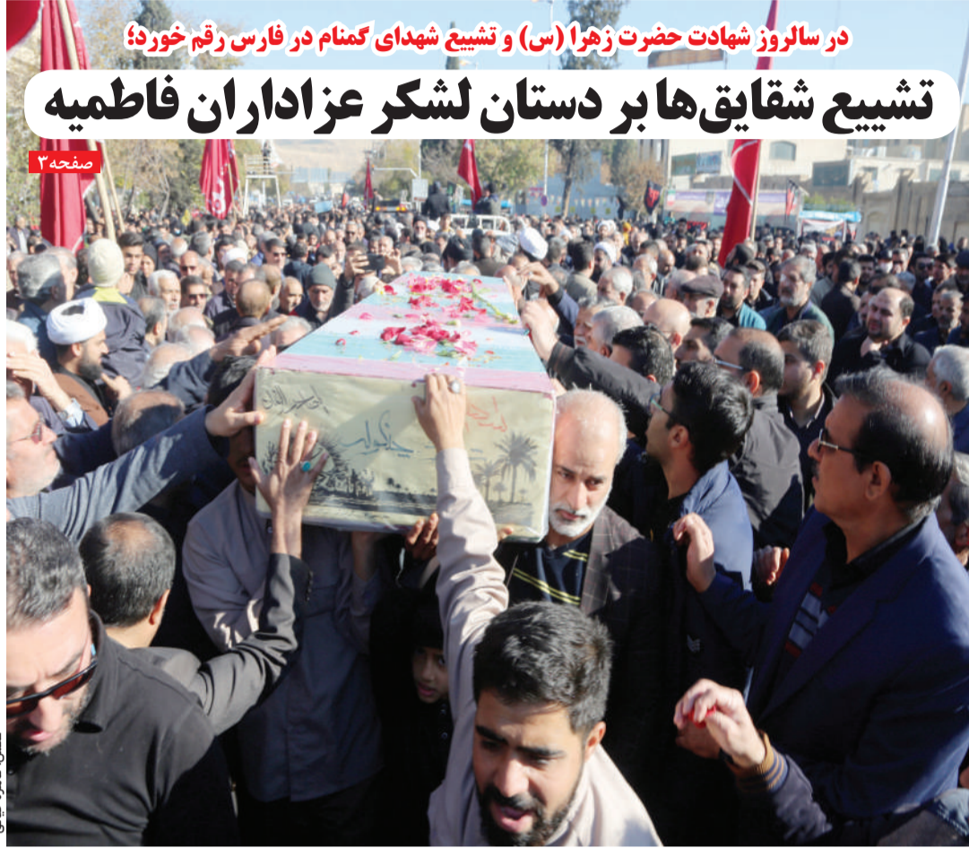
در سالروز شهادت حضرت زهرا (س) و تشییع شهدای گمنام در فارس رقم خورد: