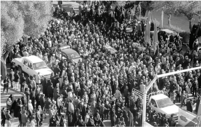
مراسم تشییع شهدای نسل جوان است

معتقدند انسان نباید کاری به مسایل پیرامونی خود داشته باشد در حالی که حضرت زهرا(س) در راه مبارزه با ظلم و در مسیر خدای طلبی به شهادت رسید. سید محمد حسینی ظهر یک‌شنبه پسن از حضور در مراسم تشییع شهدای گمنام در شیراز، در اجتماع مردم شهیدپرور سروسنان این شهر را دیدار مردان اهل فرهنگ و صاحب ذوق و هنر دانست و گفت: وجود ۱۵هزار شهید در استان فارس و صدها شهید در این شهر شایگتر روحیه ایثارگری مردم این خطه از ایران است. معاون پارلمانی رئیس‌جمهور بیان کرد: امروز ۲۸۰ شهید در جای‌جای کشور در حال تشییع هستند که تنها با خدمت به مردم و تحقق آرمان‌های انقلاب می‌توانیم