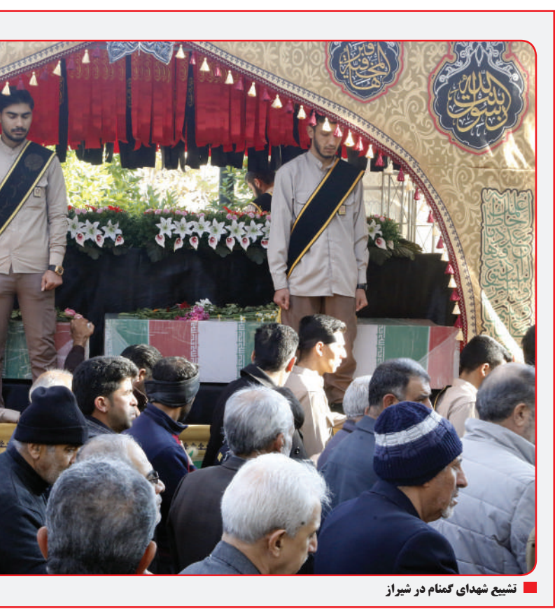
تشیع شهدای گمنام در شیراز