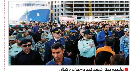
تشیع پیکر شهید گمنام - جزیره کیش