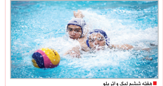
هفته ششم لیگ واترپلو