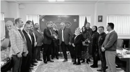
استاندار فارس در جریان بازدید از نمایشگاه ملی صنایع مسکن و ساختمان در شهر خفر. در این سفر با مساعدت وزیر گردشگری، سطح فعالیت‌های فرهنگی، گردشگری و زیارتی منطقه ارتقا خواهد یافت.

به گزارش سبحان، نشست هم‌اندیشی هیئت شرکت حمل‌ونقل بین‌المللی یورو کارگو کشور یونان و معاونت گردشگری استانداری فارس برگزار شد.