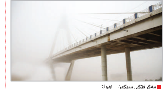
مک‌فرنگی سنگین - اهواز