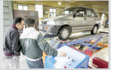
معاون حمل و نقل و ترافیک شهرداری شیراز بیان کرد:

سه روز دیگر تا پایان پاییز باقی مانده است و کمبارش‌ترین پاییز را فارس سپری کرده است. وضعیتی که در تمام کشور حکم فرما بود. این حجم کم بارش‌های باران با کم‌آبی سدهای ذخیره آب نشان از تابستان تشنه می‌دهد، هر چند که هنوز می‌توان امیدوار به بارش‌های زمستان باقی ماند. مدیرکل هواشناسی فارس گفت: طبق پیش‌بینی‌های انجام