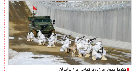
تکمیل دیوار مرزی ترکیه در مرز با ایران